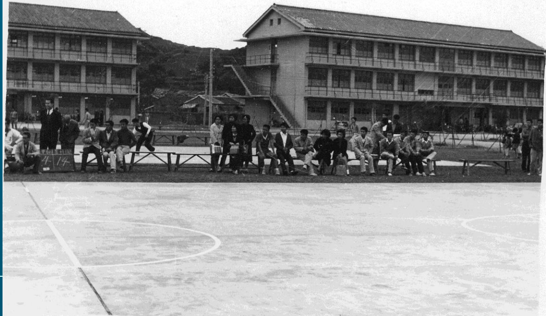
民國51年的 北醫校園