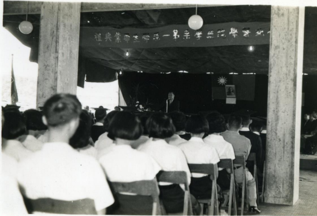
民國52年，北醫藥 學系第一屆畢業典禮